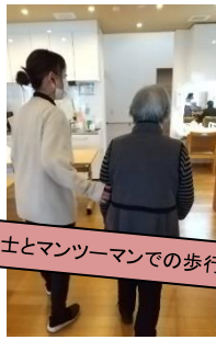
訓練士とマンツーマンでの歩行訓練