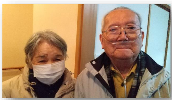
ご夫婦仲良く2ショット♡いつまでもお元気で♪

疾病により寝たきりに近い状態から病院にてリハビリを頑張られ、退院後は花の木こざのを利用開始、当初は両足首に装具を装着、歩行器使用し歩かれていました。花の木こざのを利用し機能訓練に一生懸命取り組まれた結果、現在は装具無しで自宅では杖や伝い歩きで歩けるようになりました。