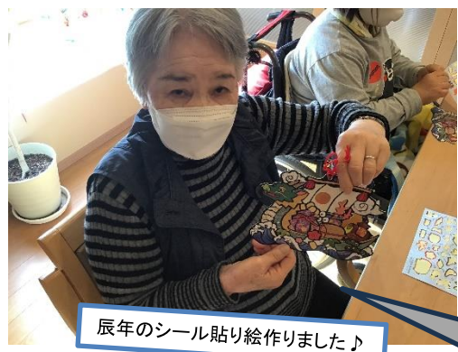
辰年のシール貼り絵作りました♪