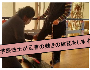
理学療法士が足首の動きの確認をします