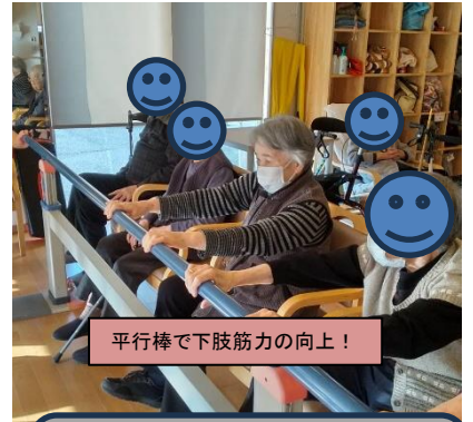
平行棒で下肢筋力の向上！