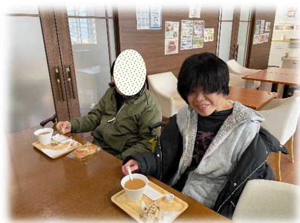
外出活動での喫茶店